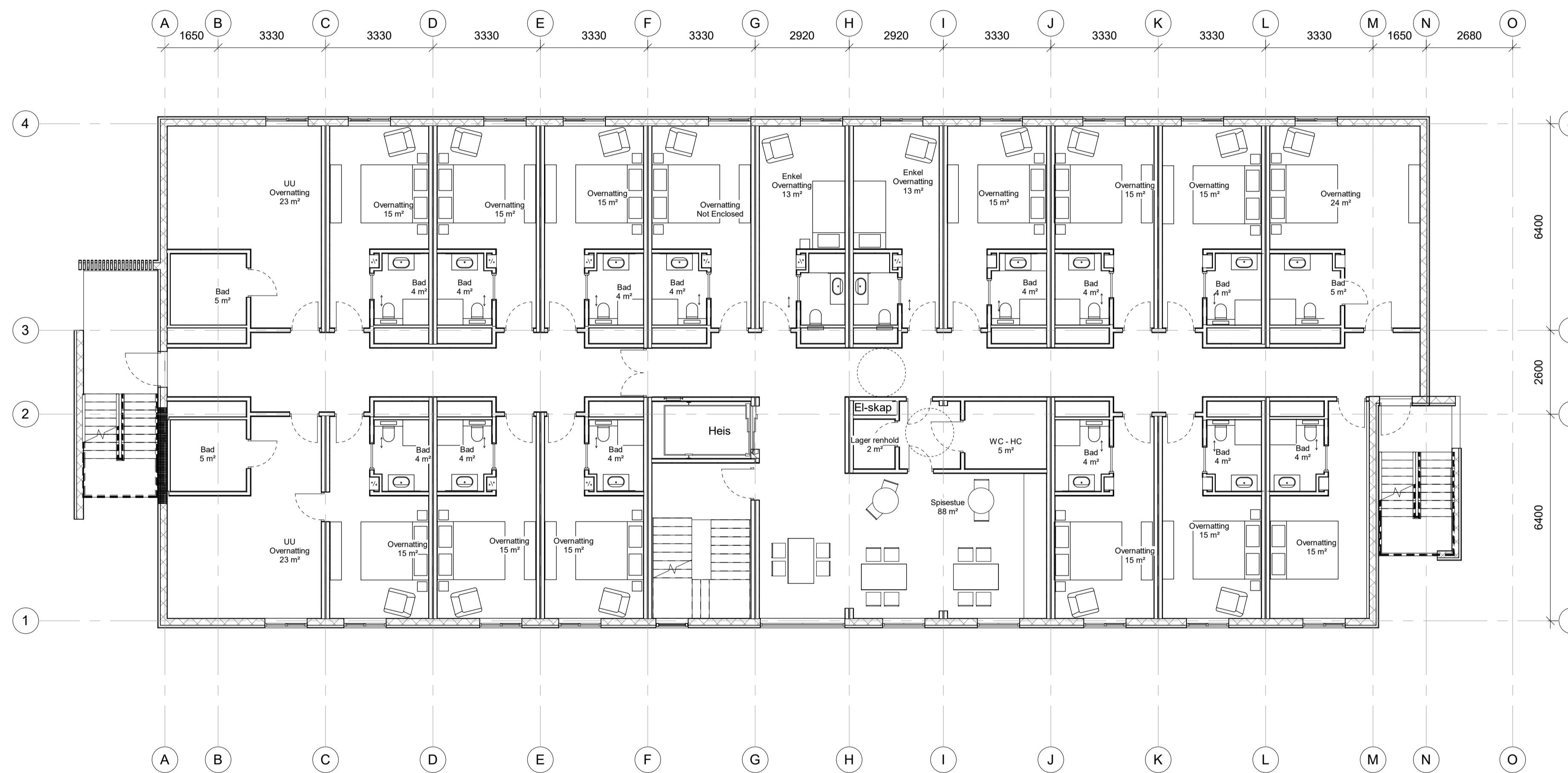
Plan 03 50 Målestokk: 1 : 100